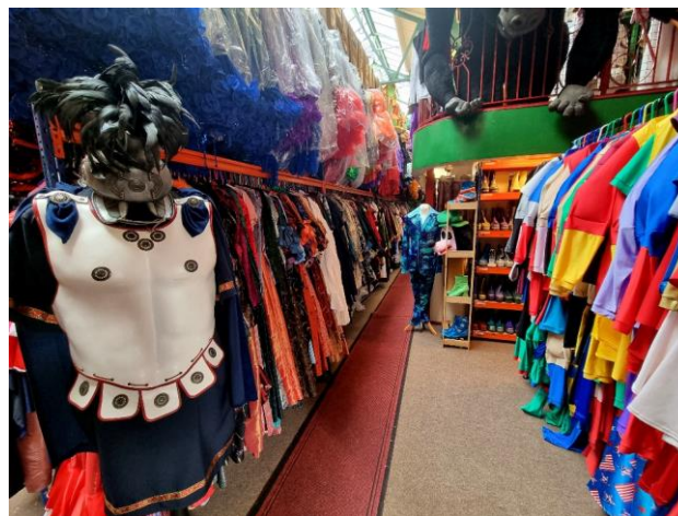
A ruházati cikkek bérlésének egy jellegzetes példája: a jelmezkölcsönző

vagy növényi (pl. szójababból nyert) fehérje, ugyancsak növényből, pl. kukoricából előállított tejsav (PLA, mint pl. az Ingeo). Ígéretes kísérletek folynak a poliamidok anyagát alkotó, eredetileg kőolaj származékból előállított kaprolaktám szintén cellulózból történő előállítására is (Sorona, Geno Nylon).