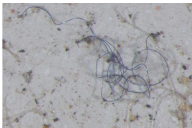
Műanyag-mikroszálak a mosógépből kiengedett szennyvízben

és a gyártási folyamatokban (vizes kezeléseket).