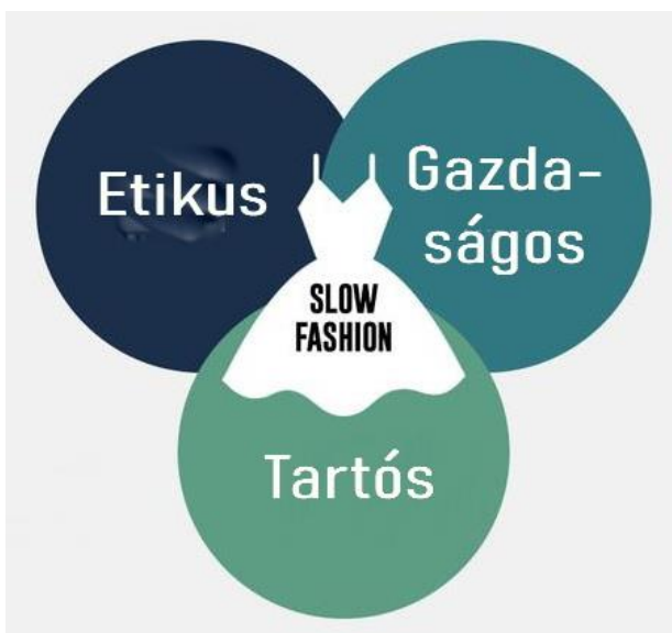
A slow fashion lényege

• A fogyasztói oldalon ösztönzi a minőség, a tartósság, a hosszabb használat, a javítás és az újrahasználat irányába történő elmozdulást (slow fashion, azaz lassan változó divat). Ösztönzi a tervezőket, gyártókat és kereskedőket, a hirdetőket és magukat a fogyasztókat a stratégiában megfogalmazott célok elérésére.