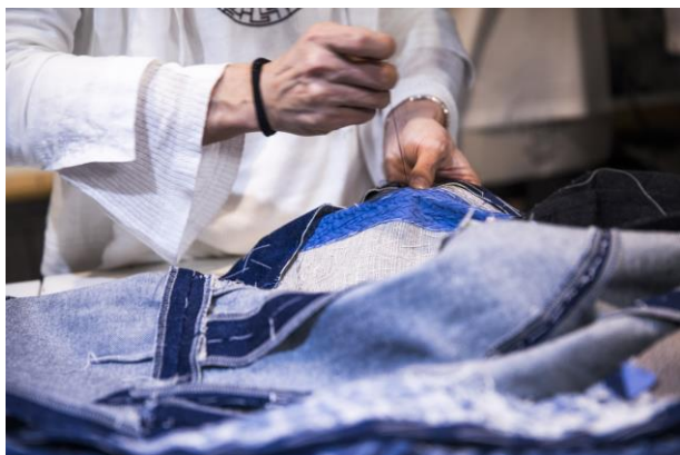
Amit lehet, javítsunk meg!

Az anyag kiválasztásánál célszerű figyelembe venni az újrahasznosíthatóság lehetőségét. Ebből a szempontból előnyök az egyetlen nyersanyagból készült darabok, legyenek azok akár természetes eredetűek (pamut, gyapjú, selyem stb.), akár mesterséges úton előállítottak, utóbbi esetben azok, amelyek önmagukban újrahasznosíthatók (pl. poliészter, poliamid 6.6). Ez azonban sokszor ellentmond a terméktől megkívánt tulajdonságok teljesíthetőségének, ami nyersanyag-keverékek alkalmazását teszi szükségessé a kelmegyártásban. A kevert nyersanyagú hulladékokban az egyes alkotórészek szétválasztása nem egyszerű feladat és ez jelenleg is jelentős kutató-fejlesztő munka tárgyát képezi. Különös jelentősége van azoknak a szálanyagoknak, amelyek természetes (növényi, állati) alapanyagúak, mert az ezekből előállított textíliák elhasználódásuk után biológiailag lebonthatók és így környezetbarátoknak minősíthetők. Ilyenek például azok, amelyek anyaga cellulóz (ilyen pl. a viszkóz, az acetát vagy a lyocell),